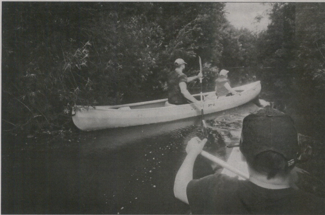
UŽAVA PIE ZIRU TILTA ŠAURA. Taču aiz katra nākamā līkuma kļūst platāka.