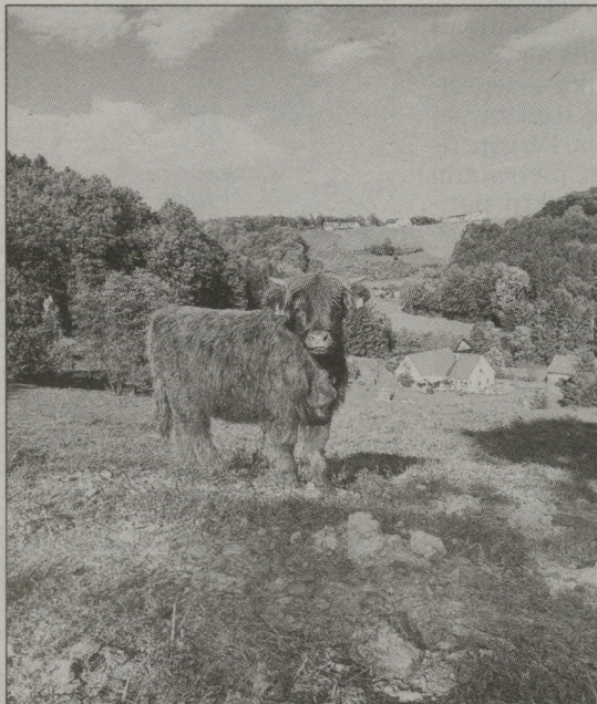
HAILANDERS AUSTRIJAS AINAVĀ. Latvieši apmeklēja saimniecībā aug 30 gaļas liellopu, tie gandrīz 30 hektāros. Saimniecībā ir kautuve un sadales cehs. Latvijas lopu audzētājiem pēdējais fakts raisīja baltu skaudību. Latvieši uzzināja, ka ierīkot kautuvi Austrijas kolēģiem ir vienkāršāk.

Kooperāciju austrieši demonstrē ikdienā — šķiet katram, kuram ir zeme, iestādīts vīnogu lauks, līdzīgi kā Latvijā tomāti