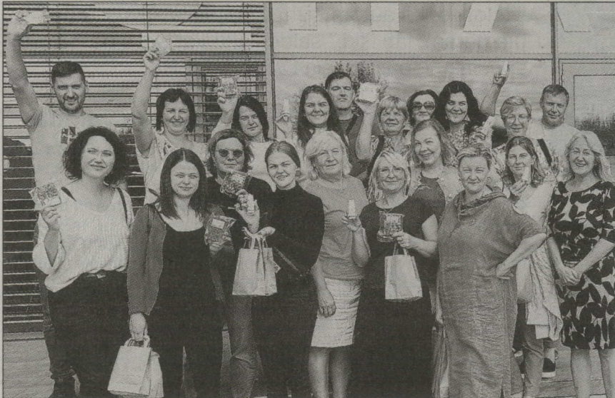
APVIENOJAS LABĀKAI PIEREDZEI. Delegācija no Saldus un Kuldīgas novada.