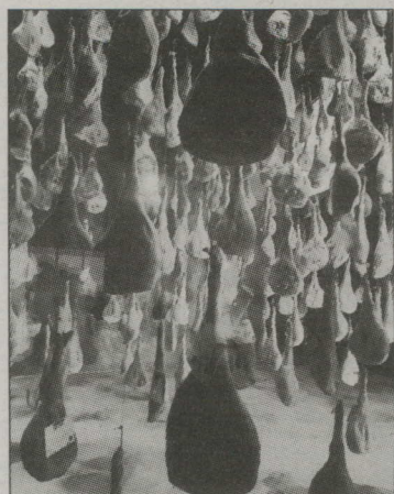
NOGATAVINA TRĪS GADUS. Pie cūku fermas ir veikals, kur apmeklētāji aiz stikla sienas redz, kā vītinas produkcija. Turpat arī restorāns, un tas nekas, ka ne daudz ož pēc mēsliem.