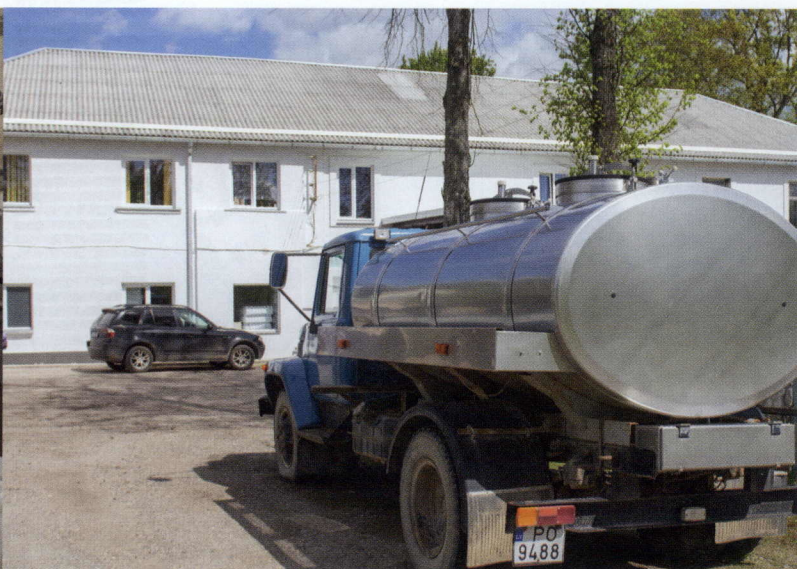
Pārstrādes iekārtas un kooperatīva ēka – bijušā Vijāņu pienotava.

ciem kooperatīvu vadītājiem, apspriest savas problēmas, doties arī pieredzes apmaiņas braucienos.