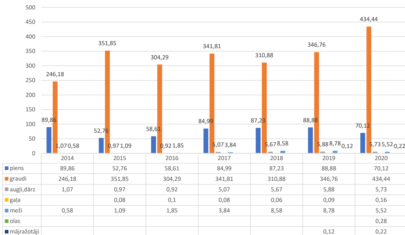
Biedru skaits nozaru griezumā 2014.-2020.gadā